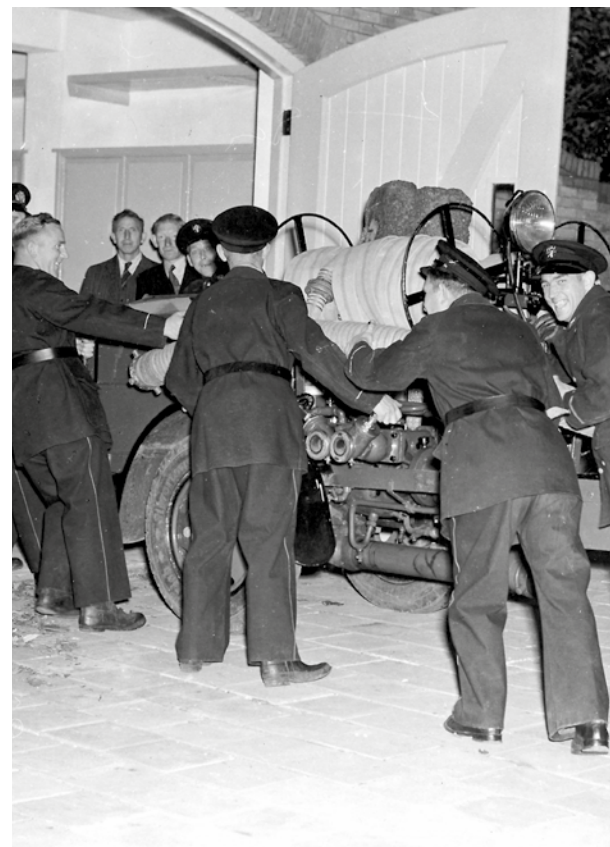
De MSA wordt de pas geopende garage aan de Dokter Lothlaan ingeduwld.

En hoewel de gemeente de noodzaak van nieuwe huisvesting inzag, dwong de nasleep van de oorlog tot zuinig beleid en dus duurde het nog enkele jaren voordat de eerste paal voor de nieuwe huisvesting de grond in kon.