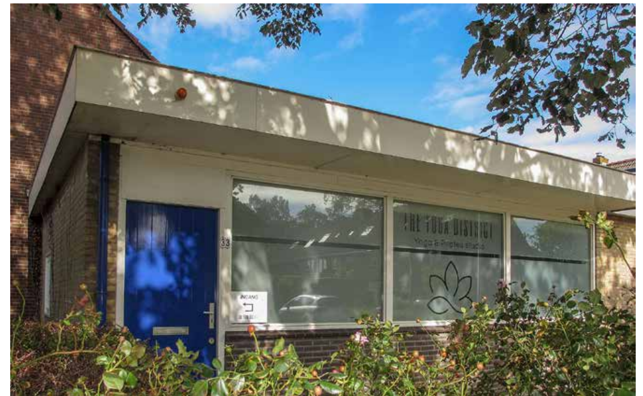
The Yoga District

En gek genoeg, met name vele dames in en buiten Woubrugge weten ineens wel de weg te vinden naar H. de Boerstraat 33.