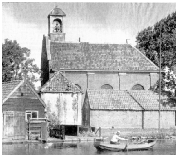
In het midden de restanten van de kerktoren, tot 1956 het onderkomen van de Hoogmadese brandweer.