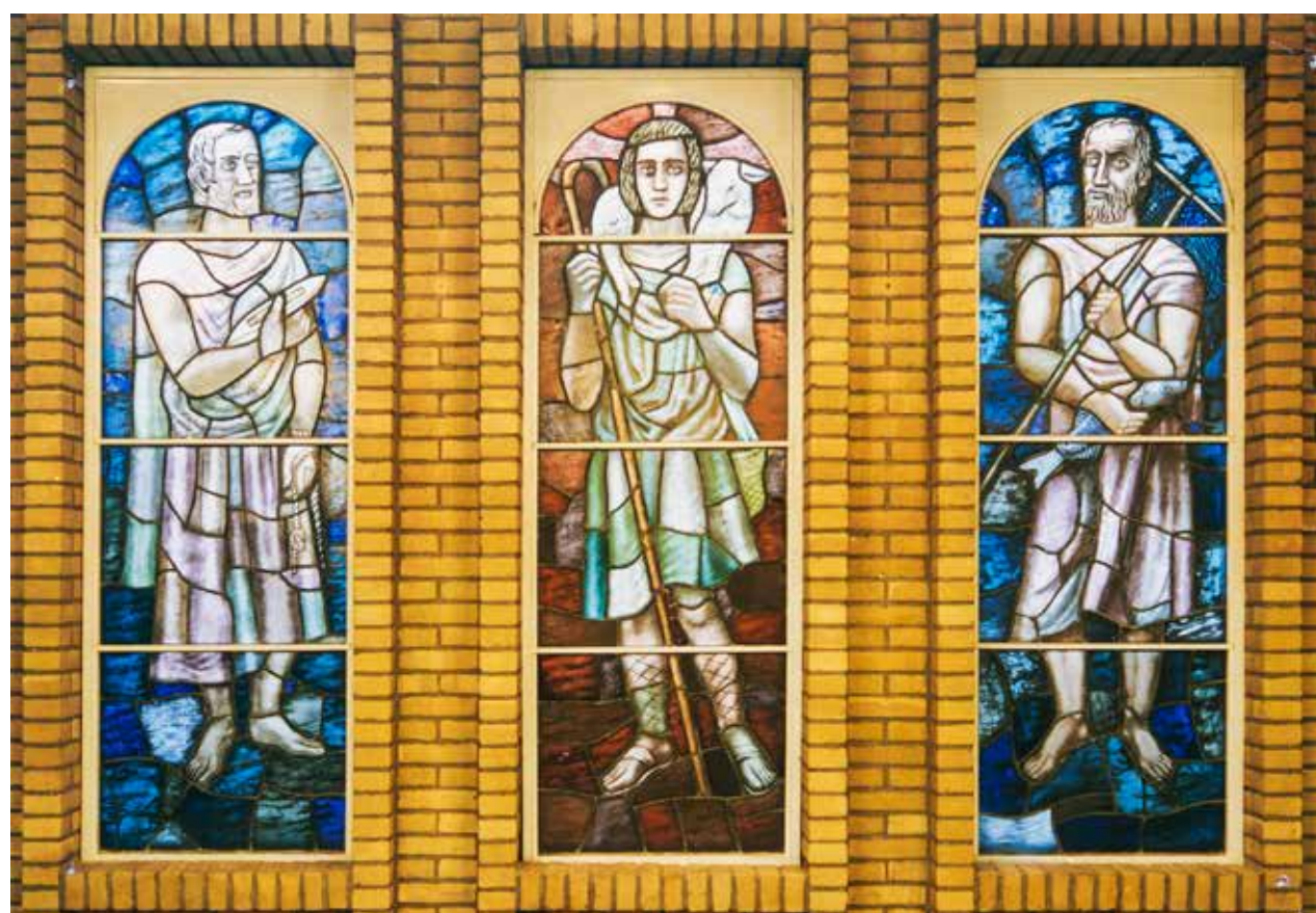
De drie gerestaureerde glas-in-lood ramen