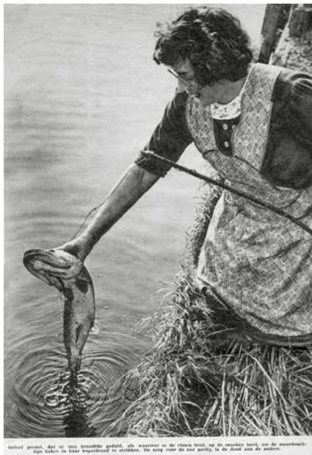
Voland groeit, dat is niet hetzelfde gebied, als wanneer se de vissen liet, se de crocken liet, se de meerdwach- tige kaken te haar kaperheid te wikkelen. De weg van de see part, se de dand van de andere.