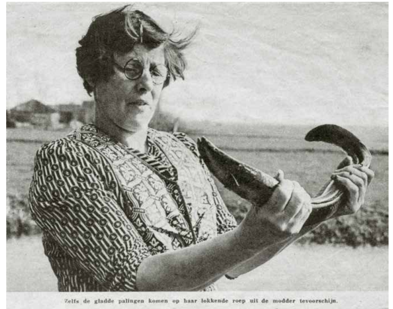
Zelfs de gladde palingen komen op haar lokkende roep uit de modder tevoorschijn.