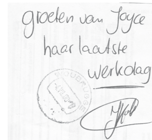
Op de achterkant van een 'Kasbewijs/BTW bon', legde Joyce met stempel de dag van sluiting/ haar laatste werkdag vast.

De volgorde van de verschillende locaties is niet geheel duidelijk, maar beelden van enkele plekken zijn er wel. Jan Stigter merkte op dat het vroeger voor sommige mensen een activiteit was die men erbij deed: "Het kan best zo zijn dat de winkelier met de klokken de post erbij deed."