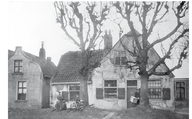
Een prachtige foto van de Comriekade uit 1910 (toen nog Voorweg geheten). Volgens overlevering is uiterst rechts nog net een stukje te zien van een huis waar ook het postkantoor gevestigd is geweest.